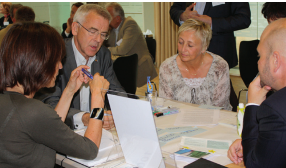
Fra Abelias sommerkonferanse